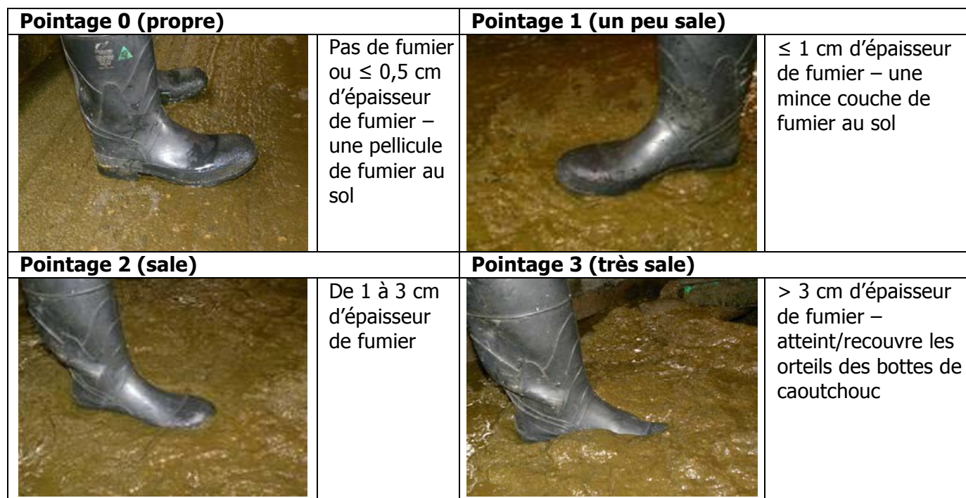
TABLEAU 2. Évaluation de la propreté du plancher