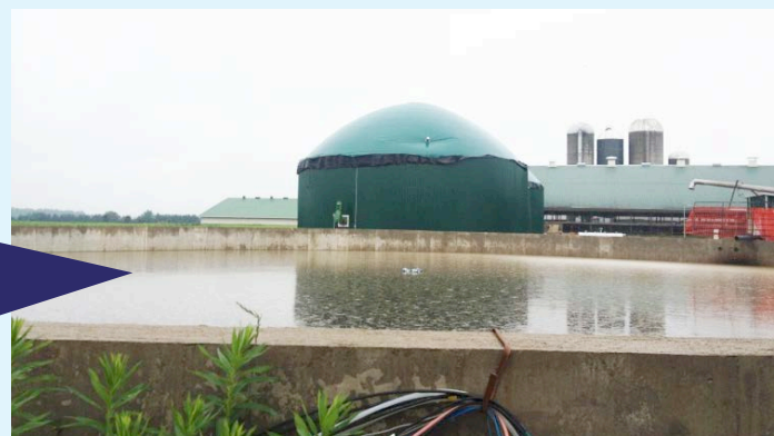
Digesteur anaérobie avec captage du méthane sous le dôme.

La taille de la ferme et la quantité de fumier produit par le troupeau ont une incidence directe sur le rapport coûts-bénéfices.